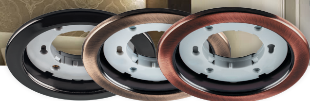
Арт. 28947 черный хром