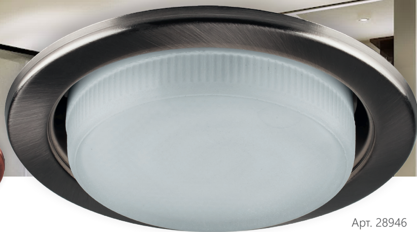
Арт. 28946 титан